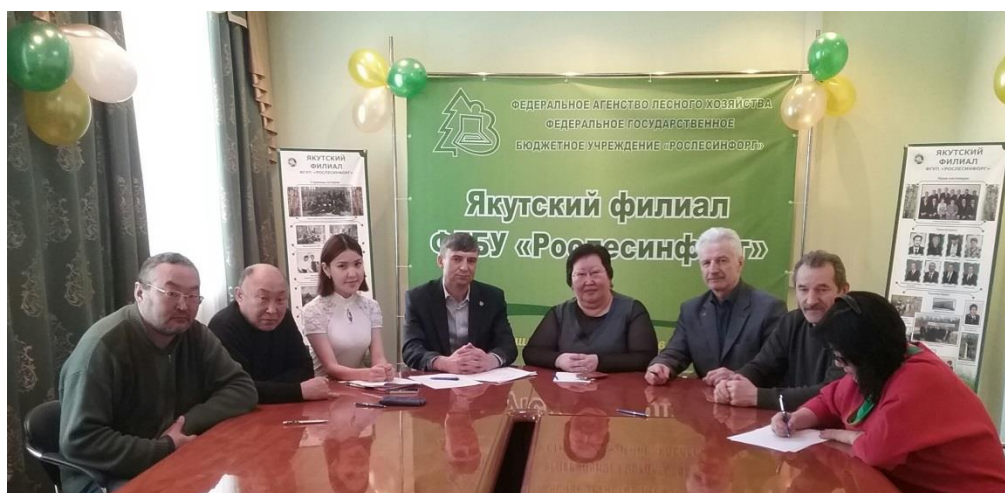
Новый состав Совета ЯРО ПП «РЭП «Зеленые»». 2016.

отдела Госохотнадзора УФС «Россельхознадзор по РС (Я)», старший госинспектор ГПС ГИМС МЧС и заместитель руководителя ОИГЭК Минприроды Республики Саха (Якутия) по юго-западному региону, специалист по экологической безопасности в представительстве МО «Мирнинский район» в г. Якутске. Кандидат в депутаты Государственного Собрания (Ил Түмэн) РС (Я) V созыва в 2013 году. В 2014 – 2016 годах председатель ЯРОО «Всероссийское общество охраны природы». Кавалер двух Орденов Мужества, награжден знаками «Отличник ГИМС МЧС России», «Отличник молодежной политики Республики Саха (Якутия)», знаком отличия Республики Саха (Якутия) «Гражданская доблесть».